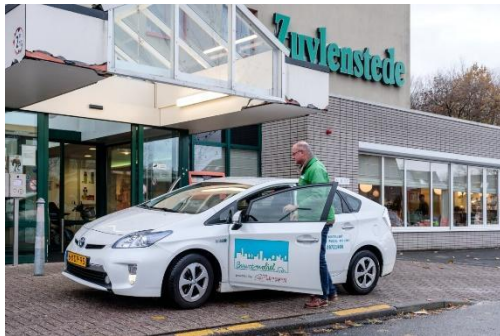
Toyota Prius bij Zuilenstede

Met de komst van de nieuwe auto's hebben alle chauffeurs rijtraining gehad in het nieuwe rijden door oud rijschoolhouder Kees Eimers.