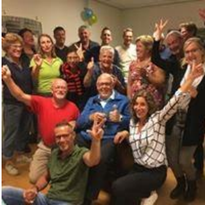
Gezellige avond met vrijwilligers ter ere van 3 jarig bestaan op 2 september 2019

Ook zijn er vrijwilligers die zelf een bijzonder klein netwerk hebben en zij zien Buurt Mobiel als middel om dit te vergroten, ook door het contact met de klanten. 'Er toe doen' en daadwerkelijk mensen kunnen helpen geeft voldoening en een gevoel van eigenwaarde.