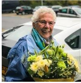
18 november 2019 is mevrouw Feringa de 18.000 e klant