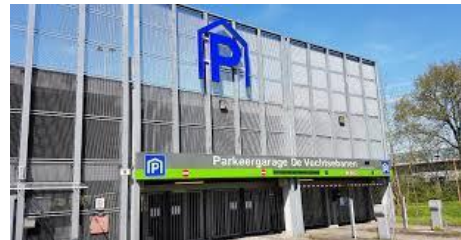
Parkeergarage Vechtsebanen Mississippidreef