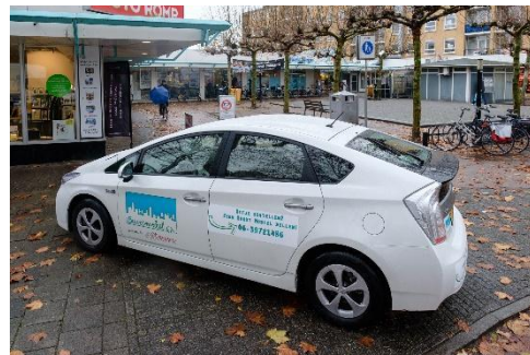
Toyota Prius bij Winkelcentrum De Gaard